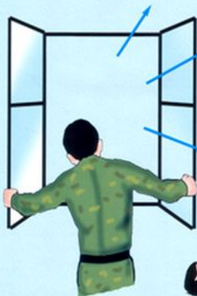
Обеспечение притока свежего воздуха

В случае потери сознания и при наличии пульса на сонной артерии повернуть пострадавшего на живот, приложить к голове холод, вызвать скорую помощь