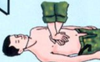
Непрямой массаж сердца