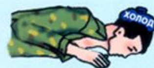
Прикладывание холода к голове