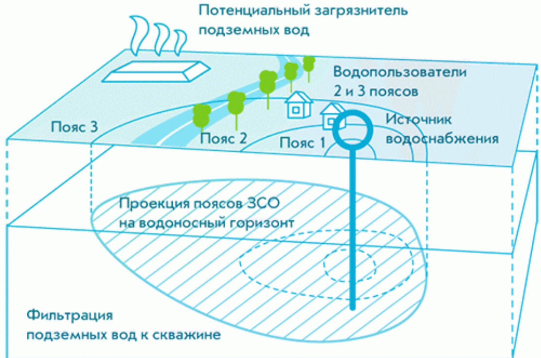
Рис. 3 Схема зон санитарной охраны источников централизованной системы питьевого водоснабжения.

Границы первого пояса ЗСО подземного источника питьевого водоснабжения устанавливаются от одиночного водозабора или от крайних водозаборных сооружений группового водозабора на расстоянии не менее: